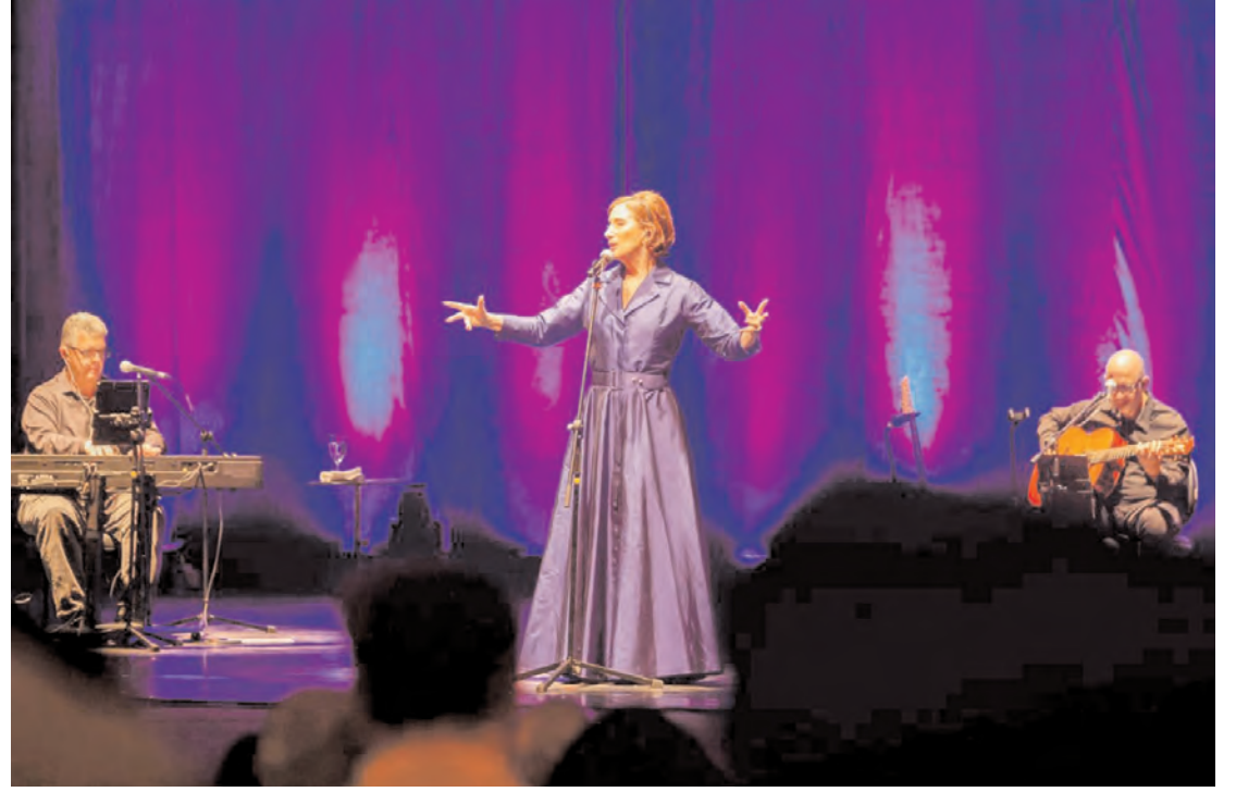
A cantora Zizi Possi surpreendeu o público que participou da cerimônia de reinauguração do Teatro Arthur Azevedo