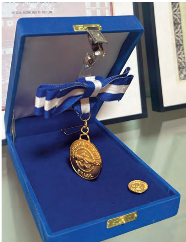
A honraria é concedida a personalidades e instituições que colaboram de forma significativa para o fortalecimento dos valores, das atividades e da integração da Marinha do Brasil com a sociedade

O evento foi marcado por momentos de reconhecimento, confraternização e valorização das parcerias institucionais que contribuem para o desenvolvimento social e marítimo do estado do Maranhão.