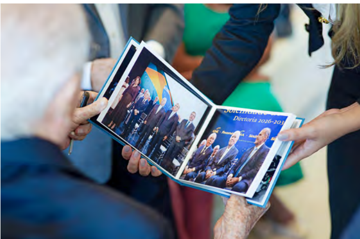
O álbum da participação de Sarney na festa da Fecomércio-MA