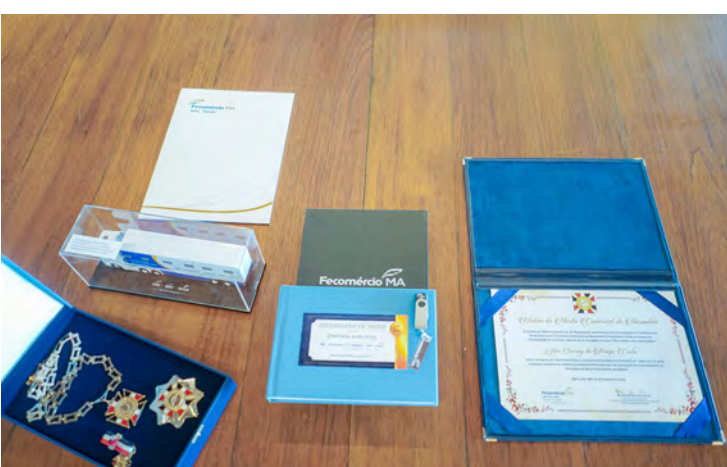
Os brindes que a comitiva da Fecomércio-MA levou para o ex-presidente José Sarney