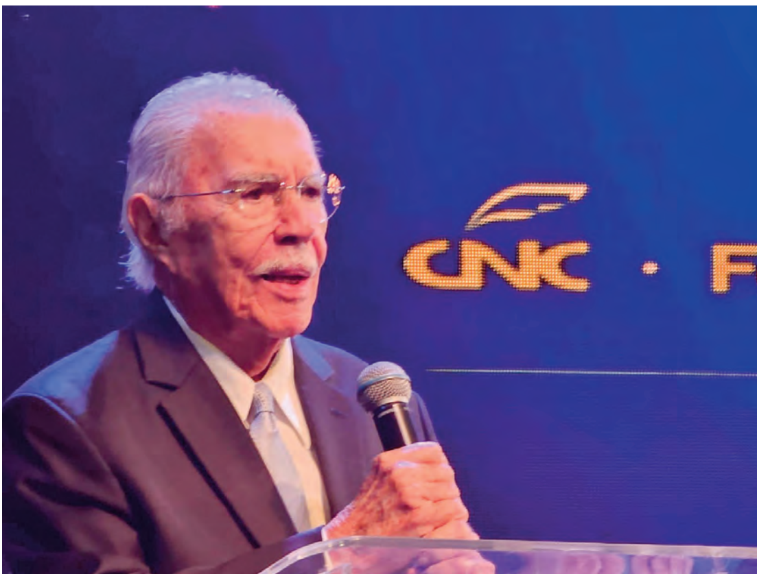
O ex-presidente da República, José Sarney, durante discurso