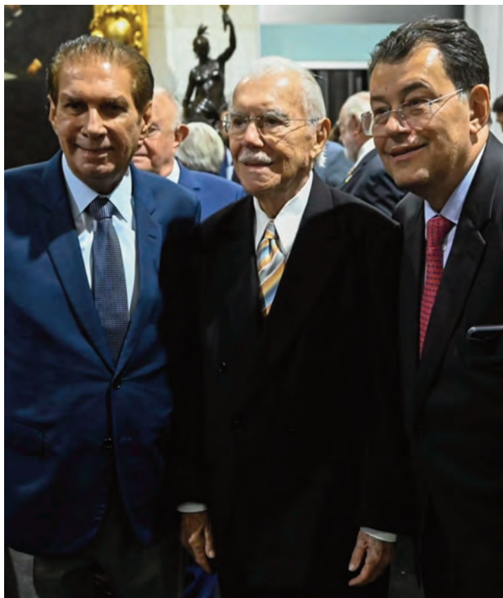
Jáder Barbalho (Pará), José Sarney e Eduardo Braga (Amazonas)