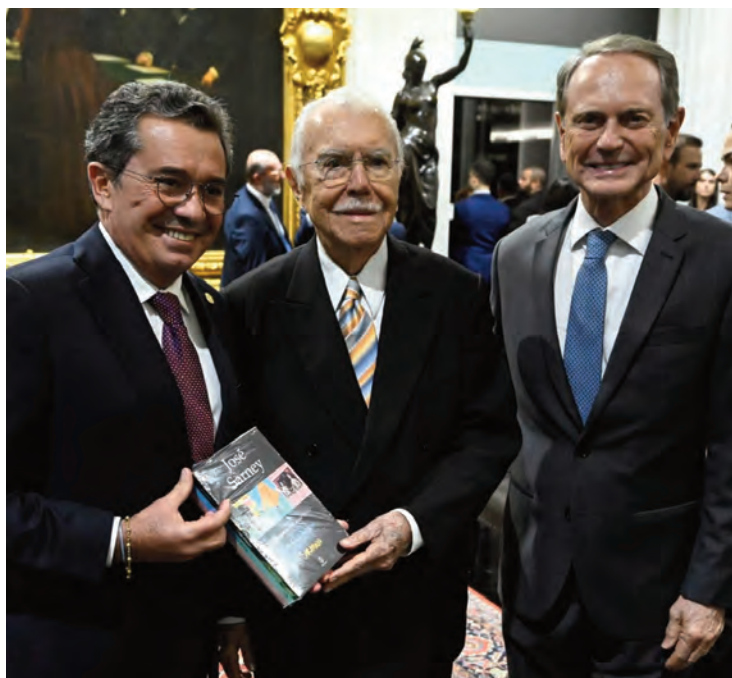
Ministro Vital do Rego Filho com ex-presidente José Sarney e o ex-senador Paulo Octávio