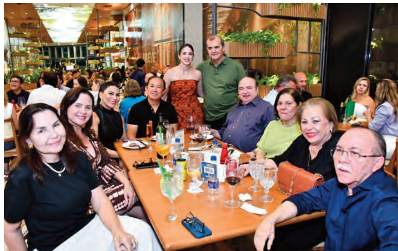
Grupo grande curtindo o ambiente da casa