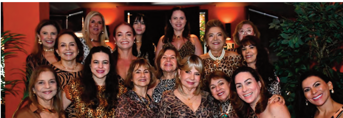
Grupo grande de amigas da aniversariante