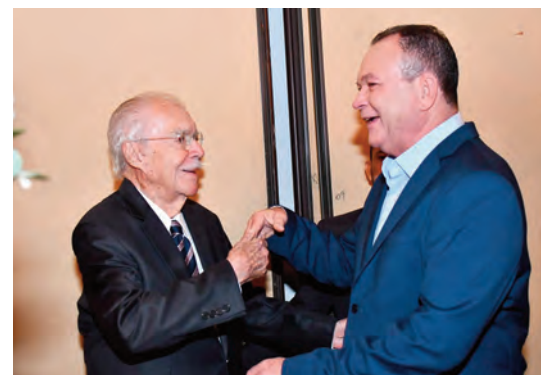
O cumprimento de dois líderes: Sarney e Brandão