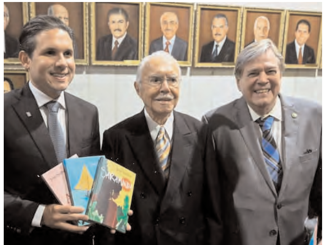
Deputado Hugo Motta (presidente da Câmara dos Deputados) com o ex-presidente da República José Sarney e o ex-senador Hugo Napoleão