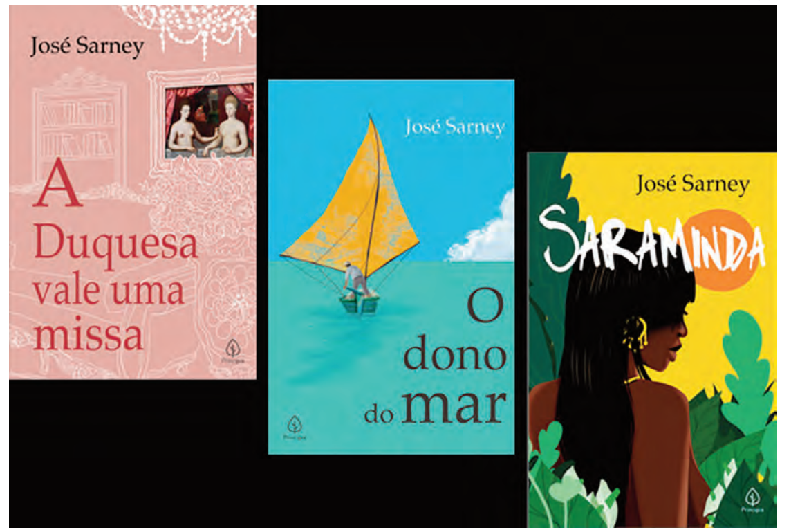
Exemplares dos romances de José Sarney relançados em Brasília