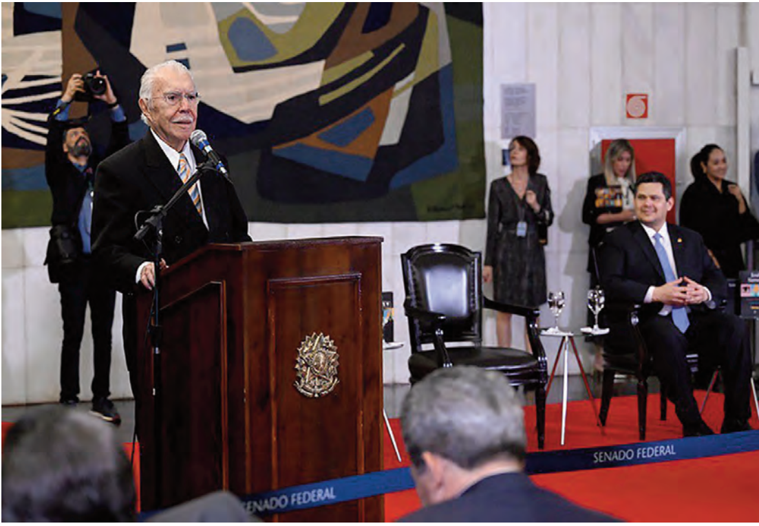
Ex-presidente da República e do Senado destacou sua trajetória na literatura e a amizade com os livros