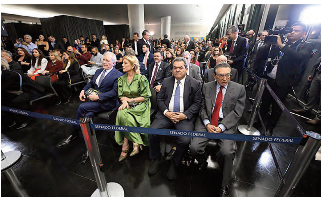
Em destaque na plateia (à direita) o ex-senador Edison Lobão