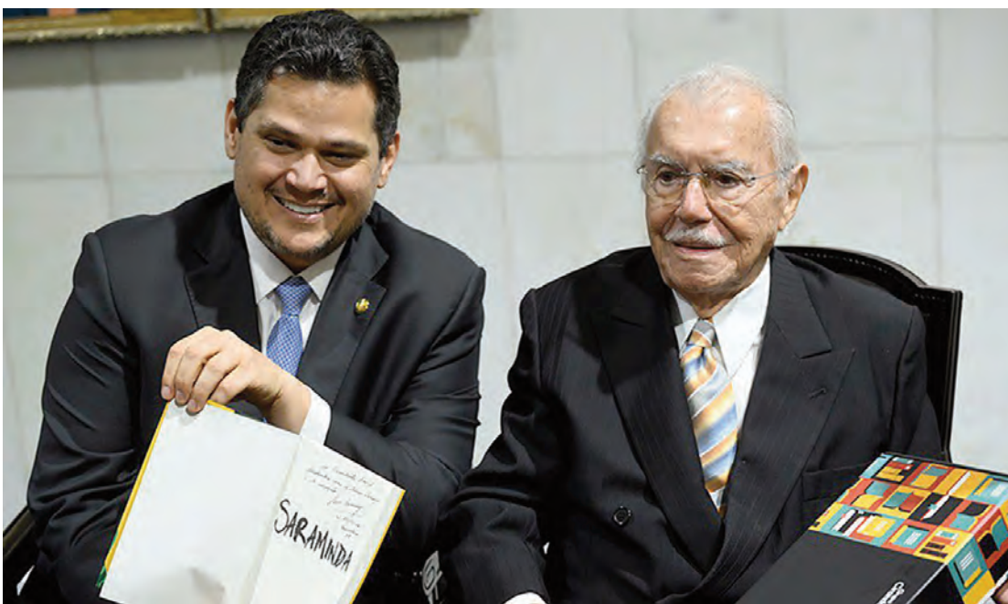
O presidente do Congresso Nacional, senador Davi Alcolumbre e o ex-presidente do Congresso e da República, José Sarney