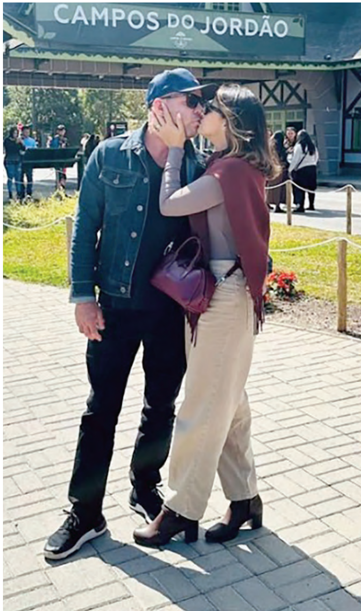
Outro momento do casal, agora em clima de love story