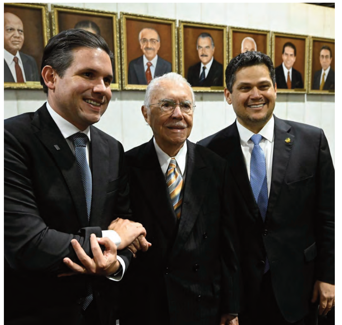
Deputado Hugo Motta (presidente da Câmara dos Deputados) com José Sarney e o senador Davi Alcolumbre (presidente do Congresso Nacional)

O evento contou também com as presenças do ministro aposentado do STF Ricardo Lewandowski; do ex-procurador-geral da República Augusto Aras; além de senadores, deputados, representantes do Judiciário, prefeitos e outras autoridades.