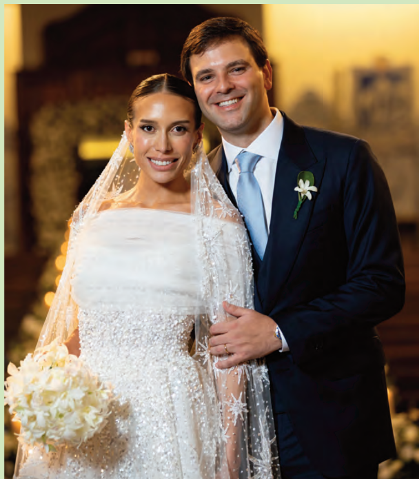
Novamente os noivos em momento especial