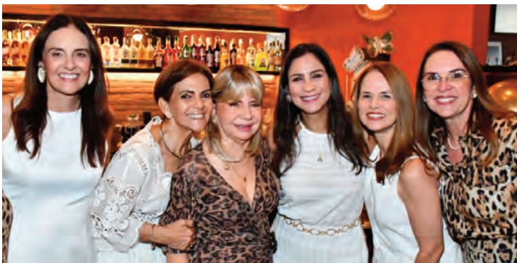
A aniversariante com um grupo de amigas