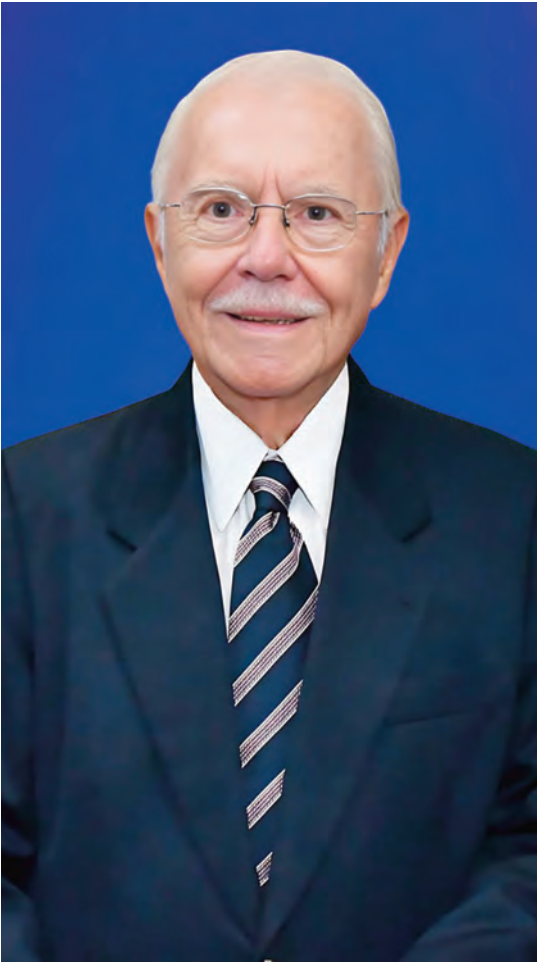
Escritor e ex-presidente da República José Sarney