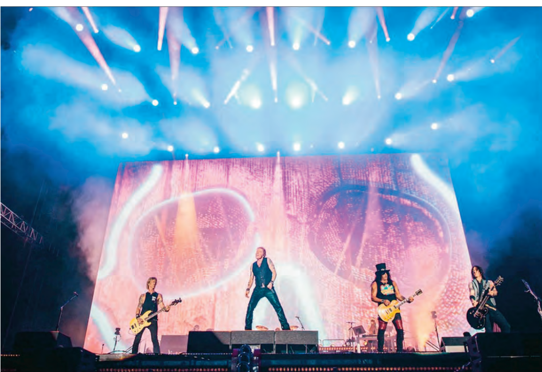
Guns N' Roses vai atrair milhares para o Estádio Castelão no próximo dia 21 de abril

O Brasil, com sua extensa costa marítima e forte vocação exportadora, depende cada vez mais de especialistas capazes de gerenciar operações portuárias, logística internacional e cadeias de suprimentos globais. O mesmo se diz do Maranhão, com o destaque do Porto do Itaqui.