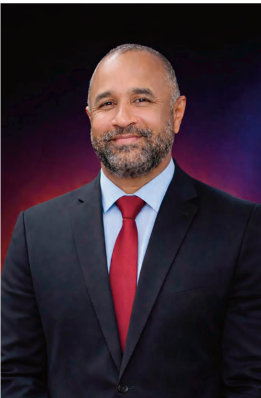
Prefeito de Bacabal, Roberto Costa