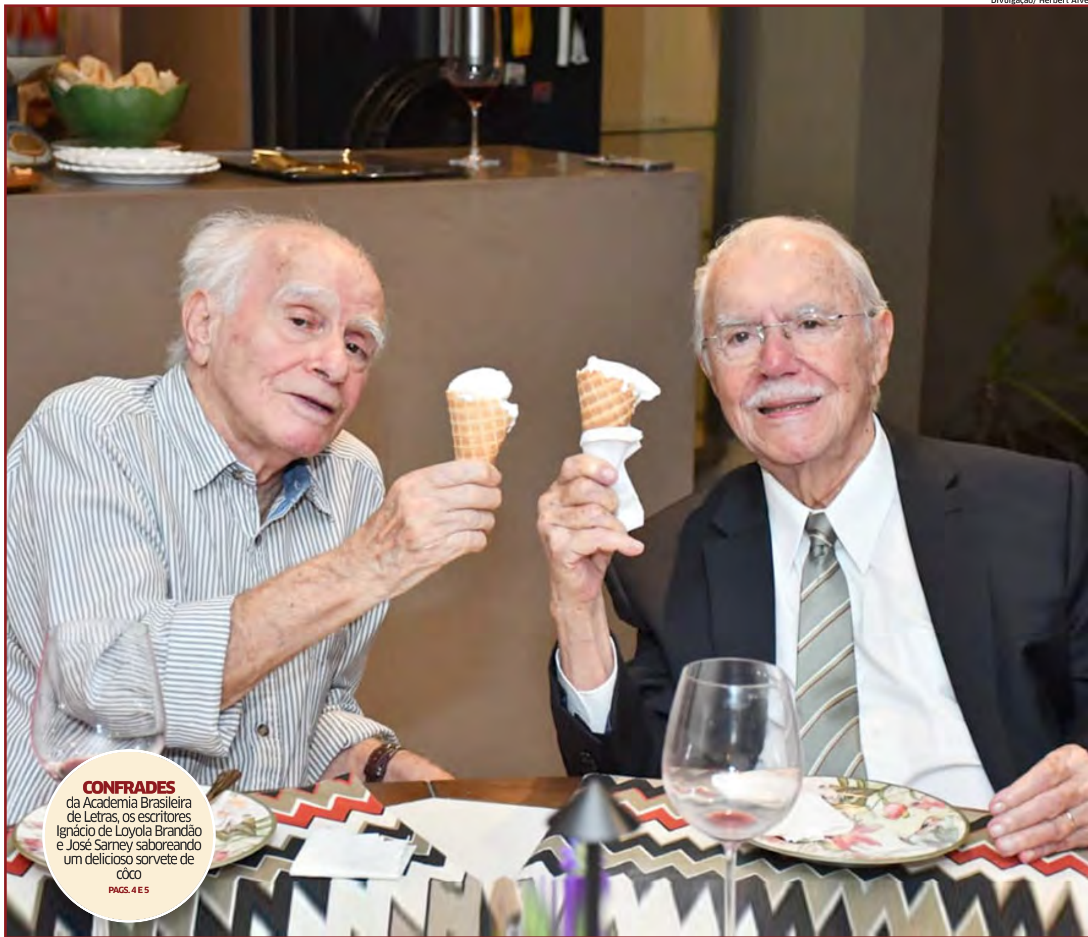
CONFRADES da Academia Brasileira de Letras, os escritores Ignácio de Loyola Brandão e José Saramago saboreando um delicioso sorvete de côco