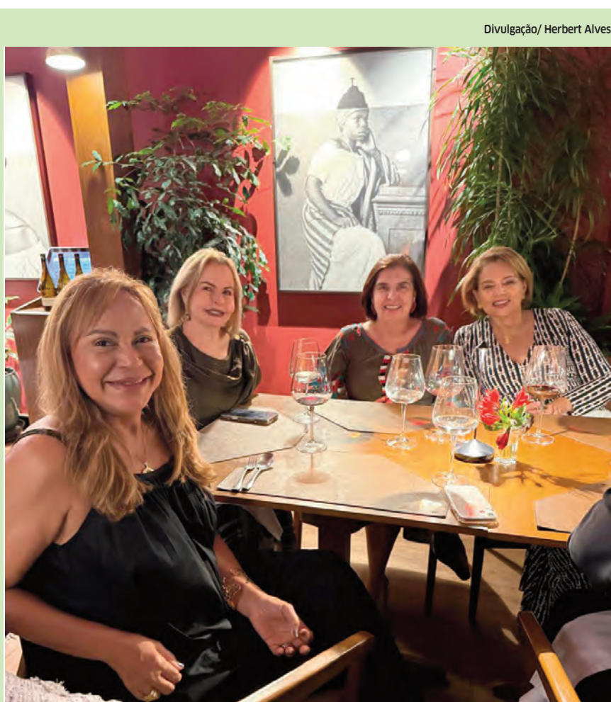
Divulgação/ Herbert Alves

Não consigo entender o que é pior e mais brutal — se os acidentes do trânsito que mata, ou o corte dos gastos de hospitais que salvam vidas!