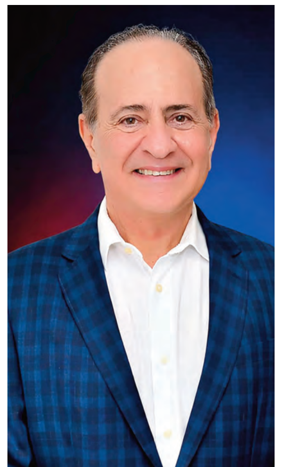
Secretário de Estado Aparício Branco Bandeira