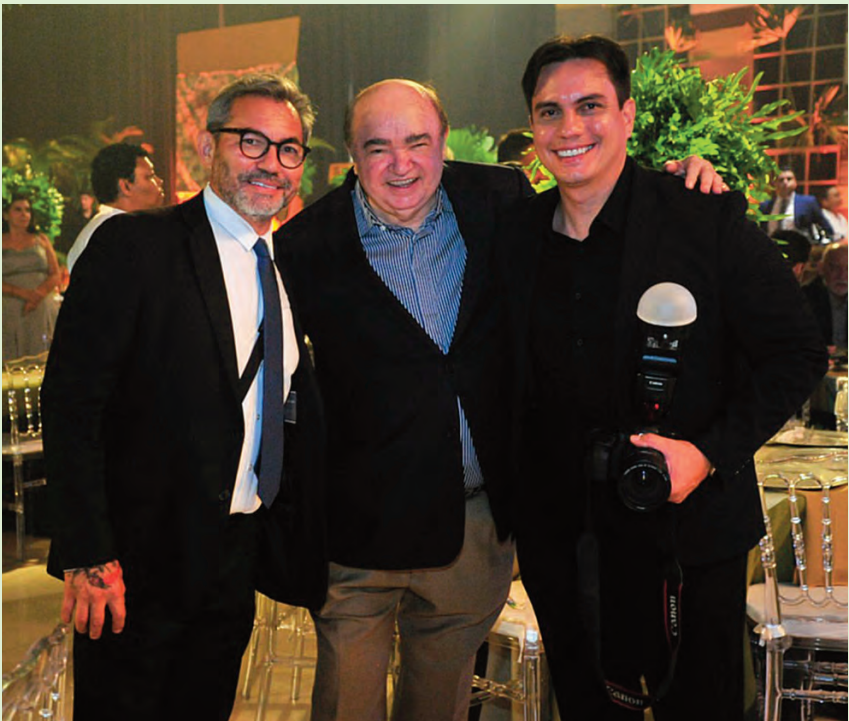
O Repórter PH com os fotógrafos Miguel Viégas e Leonardo Lima, que fizeram a cobertura fotográfica da festa