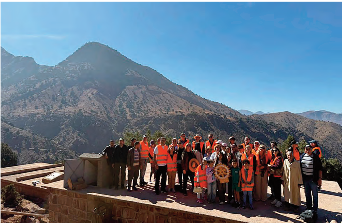
Comunidade e autoridades locais com rotarianos da Espanha, Estados Unidos e Marrocos reunidos na região marroquina do Atlas, em missão humanitária liderada pelo Rotary Club Casablanca Oasis