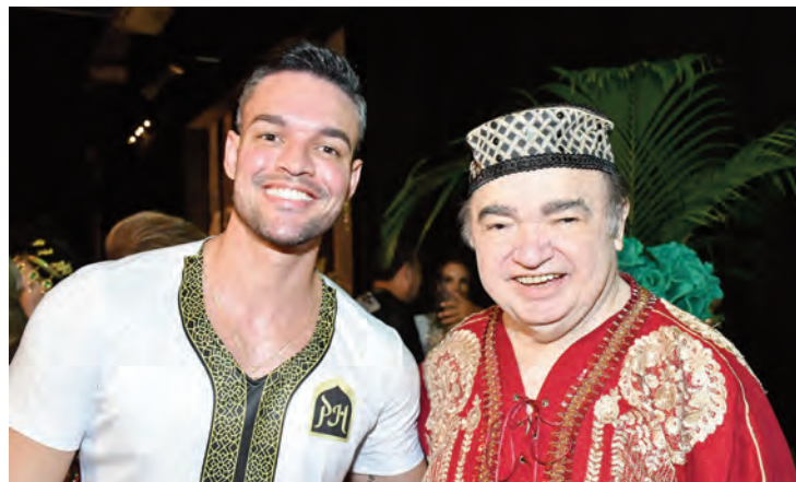
Andresson Jardins e o PH