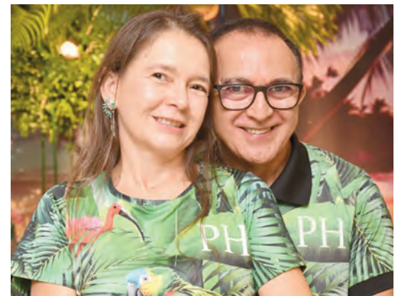
Rosário Buenos Aires e Solfière Alavá