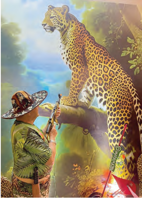
Moacir Machado se vestiu de caçador e pegou a arma (fake) para abater a onça