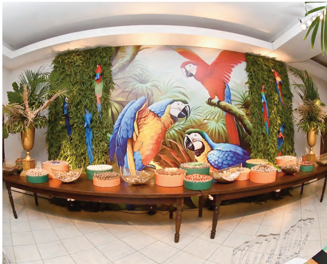
Vista panorâmica da linda mesa de doces