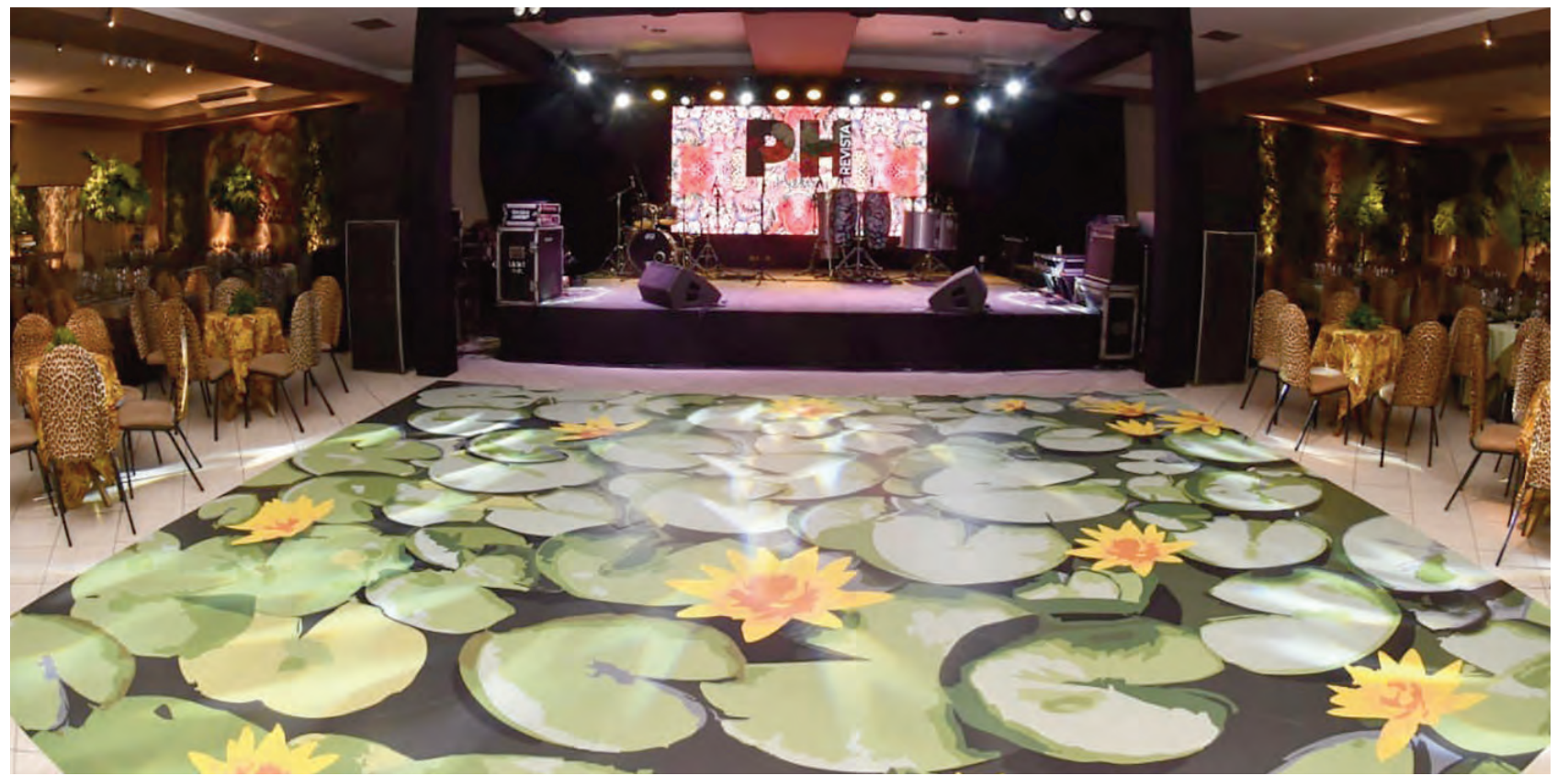
Vista panorâmica da pista de dança com uma floresta de vitória-régias