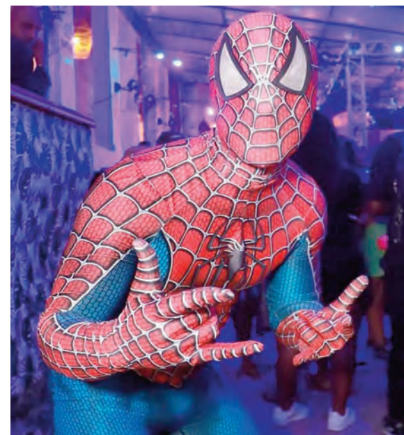
Até agora, ninguém conseguiu descobrir a verdadeira identidade do misterioso Homem-Aranha que não perde um domingo no Casarão Colonial

Além disso, o domingo promete mais uma tarde/noite de folia naquele endereço da Rua Afonso Pena, pois o Bloquinho do Casarão chega com uma versão neon. E a ideia é literal, pois todo o espaço estará iluminado com essas luzes cintilantes que encantam os nossos olhos. A produção anunciou que serão dez horas de música e várias atrações.