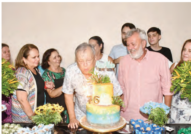
O aniversariante soprando as velas do bolo