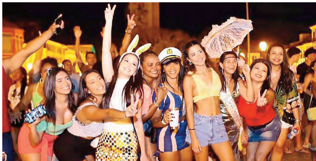
A Charanga da Baronesa anima as ruas do Centro Histórico e os foliões sempre deságuam no Casarão Colonial, onde a festa continua até altas horas