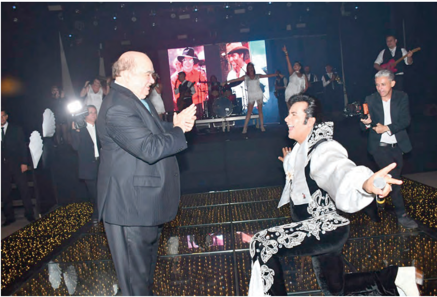
Num gesto do maior carinho e simpatia, o cantor performático Hélder Moreira se ajoelhou para saudar este Repórter PH no palco durante "Elvis, o Musical"