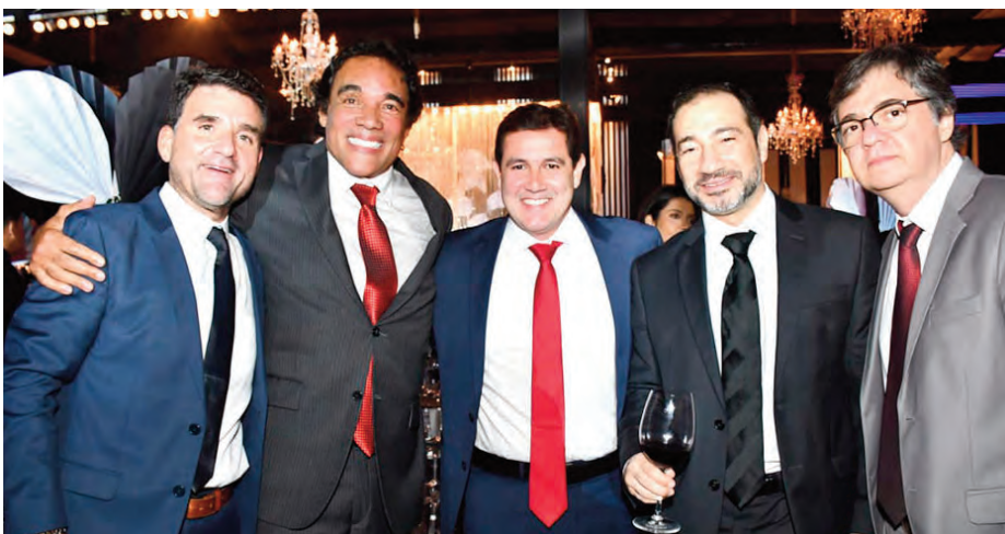
Grupo de grandes amigos em clima de confraternização