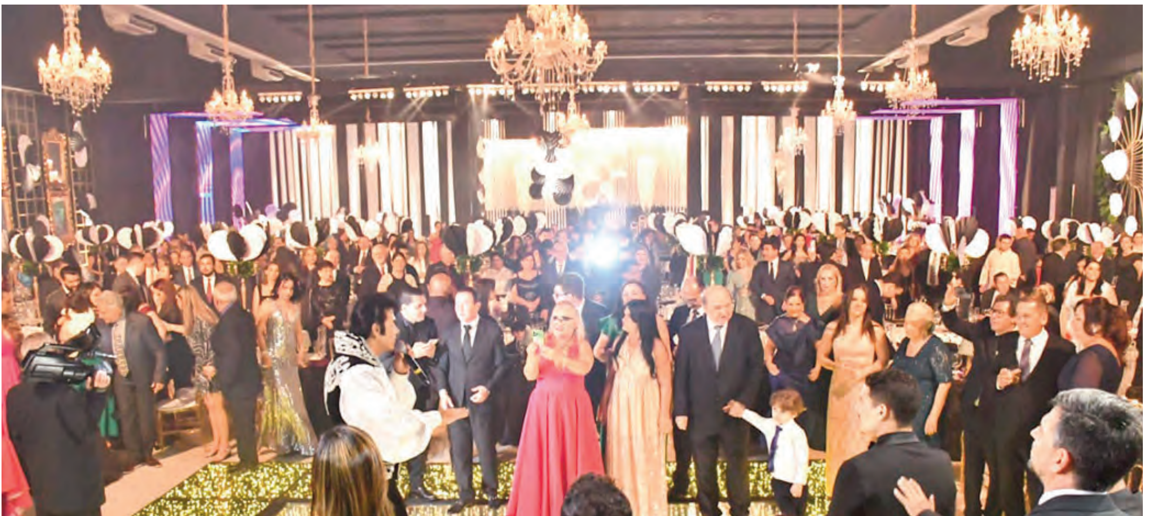
O salão visto do palco, com os convidados na pista de dança