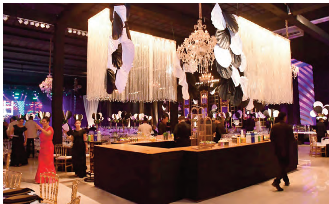
Na entrada do salão da festa, Silvia e Sergio Parente brindaram nossos convidados com um coquetel temático usando os produtos que representam em São Luís