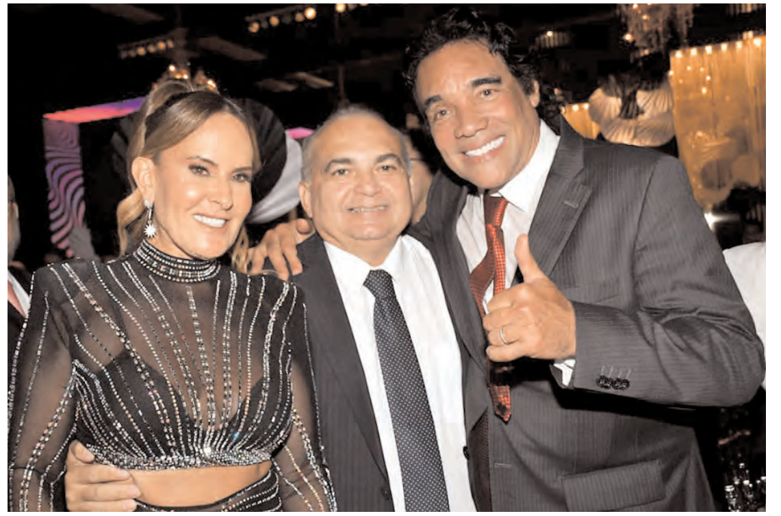
Paulinha e o ex-senador Edinho Lobão com o ex-deputado Fábio Braga