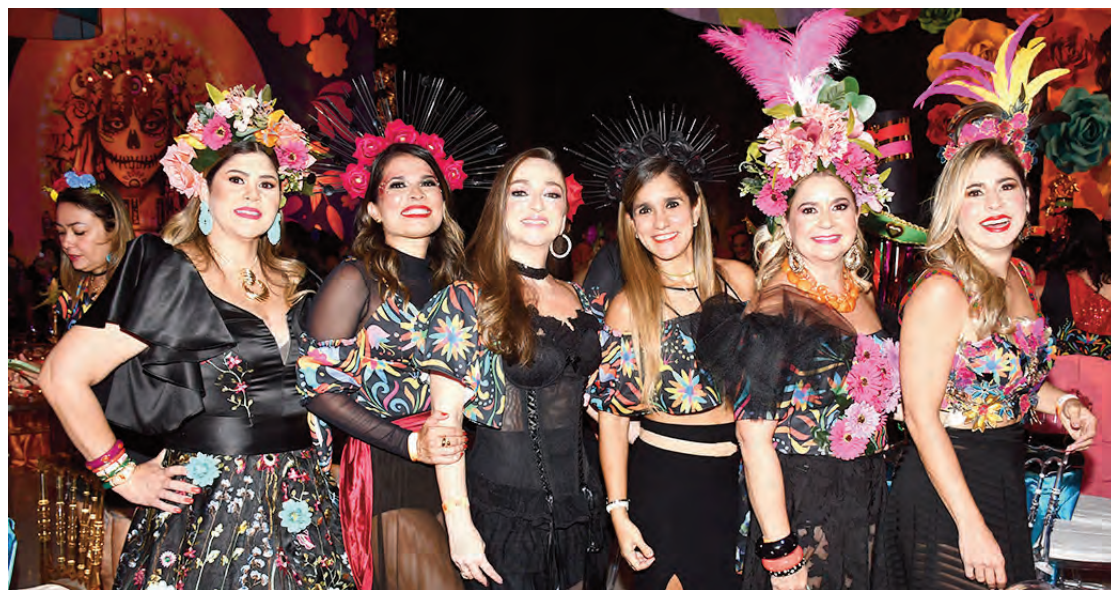
Grupo de lindas mulheres fantasiadas em grande estilo