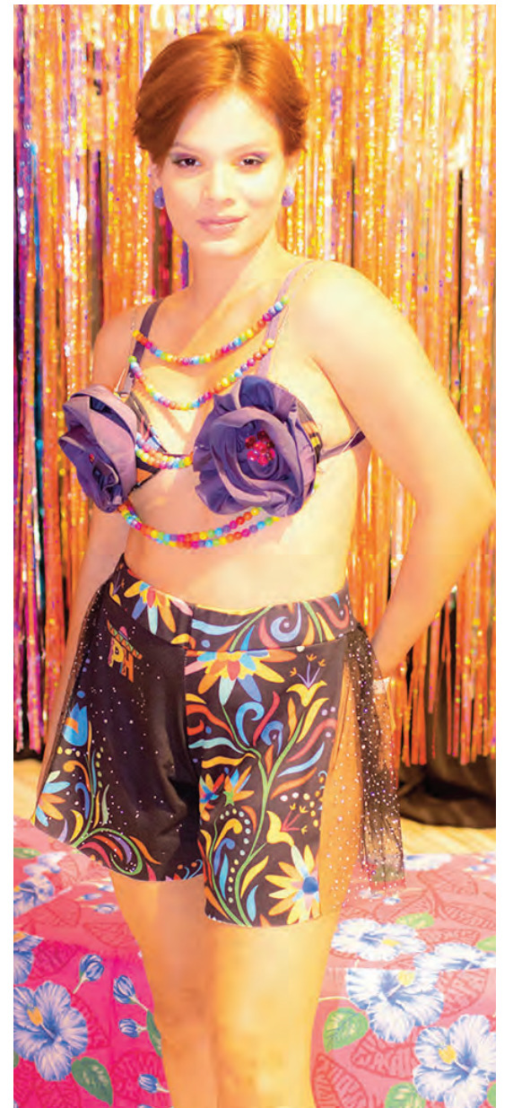
Digital Influencer Luanne Holanda