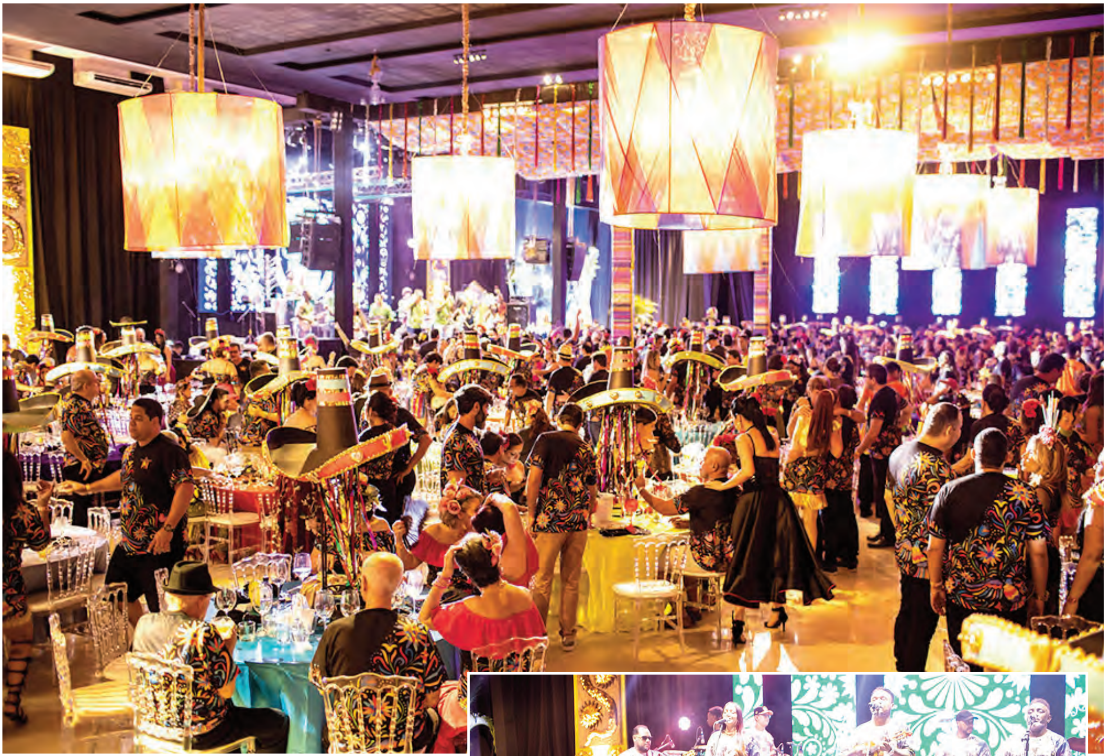
Vista panorâmica do salão no início da festa mais deslumbrante do Carnaval maranhense de 2023; e apresentação da Corte do Rei Momo