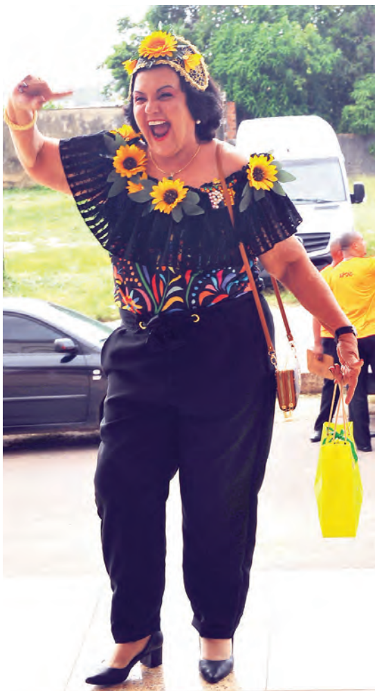
Ex-primeira dama Zenira Massoli Fiquene