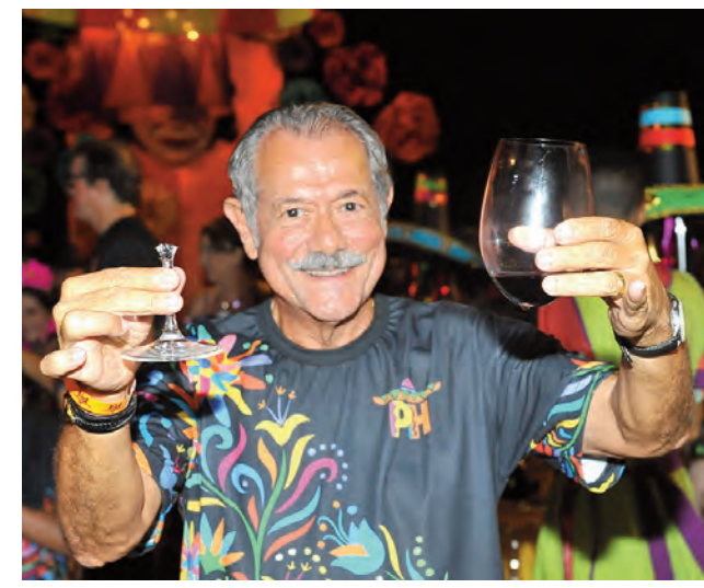
O ex-prefeito e ex-deputado Albérico Filho salvou a taça, o vinho e a alegria