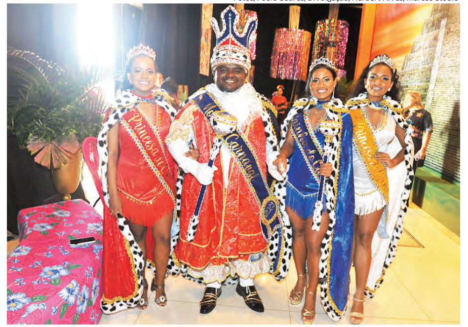
A Corte de Momo com o Rei, a Rainha e as Princesas visitou a festa