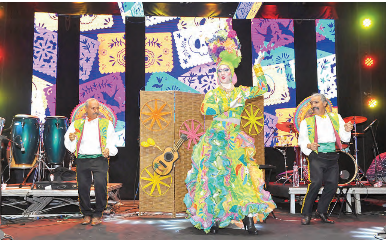
Um dos momentos mais bonitos da festa foi a homenagem à eterna Carmen Miranda, relembrando o show que ela fez no México, na primeira metade do século passado