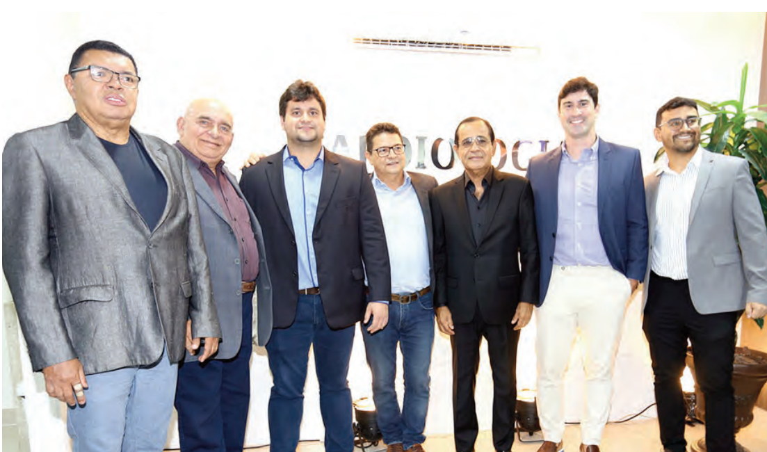
O conceituado Grupo de Cardiologistas da Natus Lumine Maternidade e Hospital