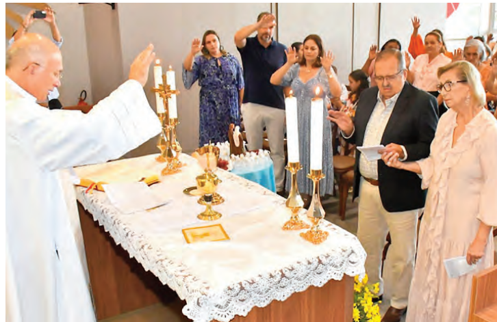
Os nubentes recebendo a bênção do sacerdote durante o ato religioso