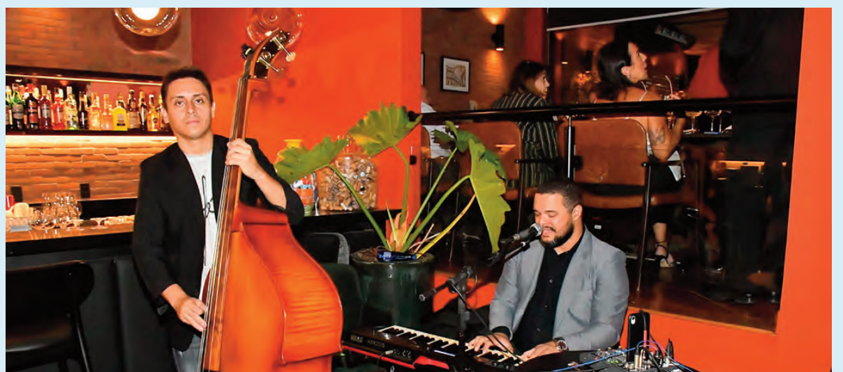
Dois artistas talentosos dando um show instrumental