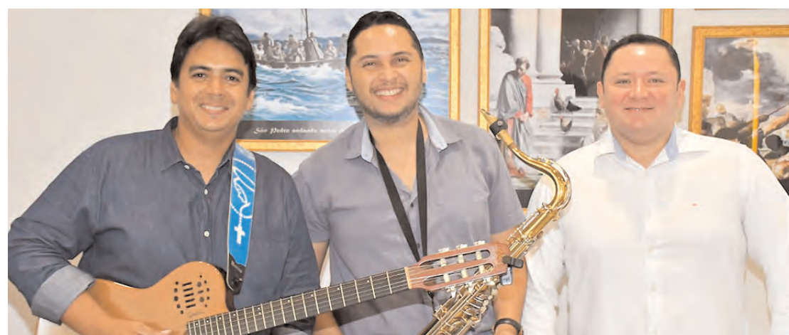
O trio musical que acompanhou a santa missa com um lindo repertório