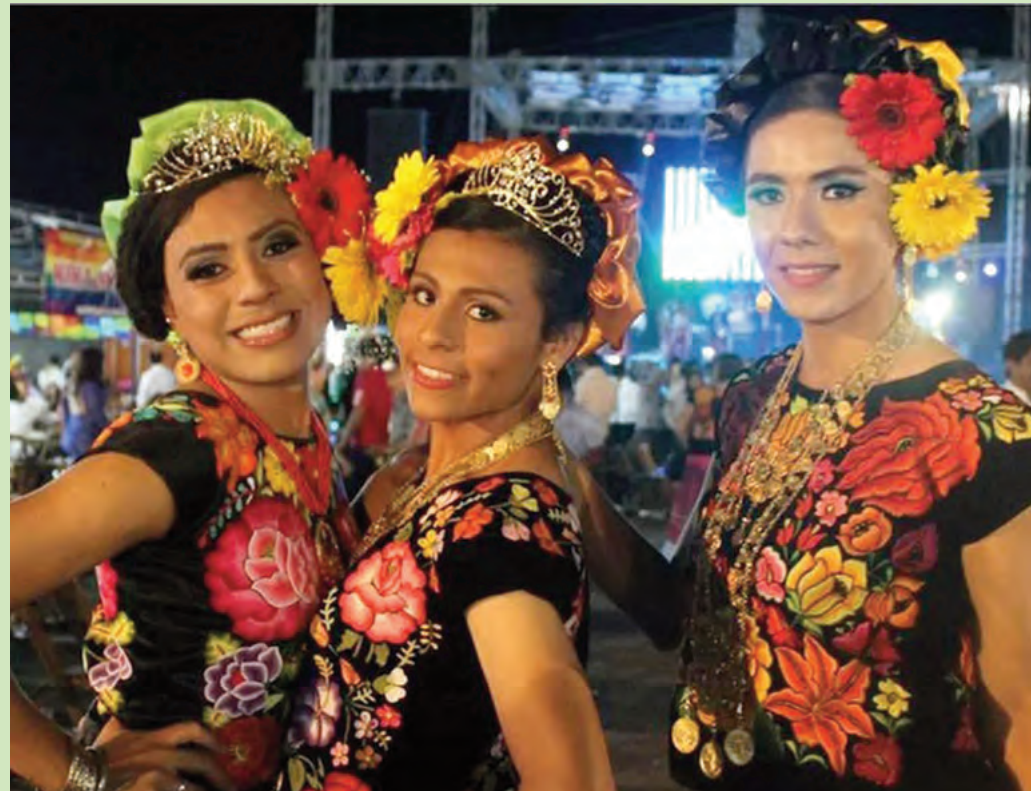
Mexicanas da região de Tehuantepec, no Estado de Oaxaca, no sul do México, podem servir de inspiração para quem for ao Almoço do PH Revista deste ano, no Palazzo

Khalo, entre outras coisas, acreditava que quanto mais liberdade as pessoas tivessem,