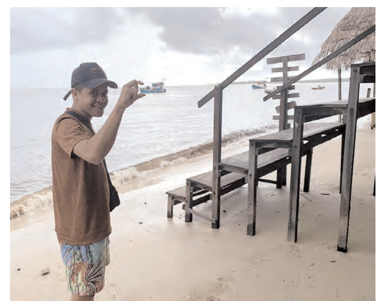
Nas aulas práticas de fotografia os guias aprenderam truques de perspectiva e noções de ângulo, que resultam em registros diferenciados