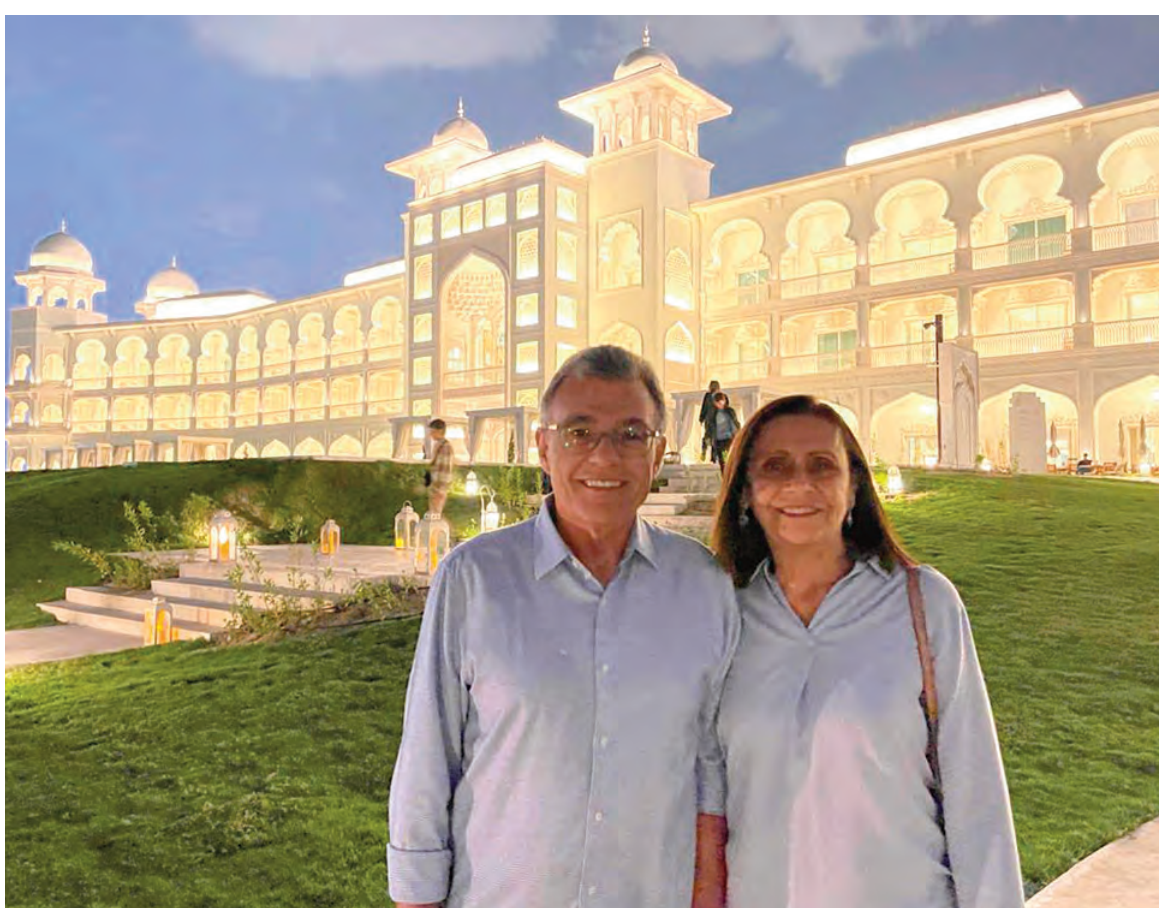
Teresa e Fernando Sarney posando em frente ao fantástico Hotel Chedi Katara & Resort, em Doha