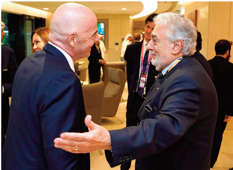
O presidente da FIFA, Gianni Infantino, recebendo o tenor Plácido Domingo na Ala VIP da entidade maior do futebol mundial

E, por sermos maioria em número de torcedores nos estádios da Copa no Catar, já entramos com uma enorme vantagem sobre os nossos adversários.