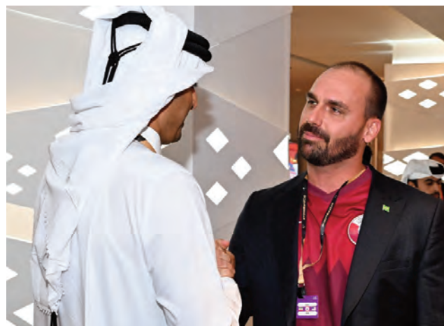
O deputado Eduardo Bolsonaro (PL-SP) com o emir e governante do Catar, Sheik Tamim bin Kalifa Al-Thani