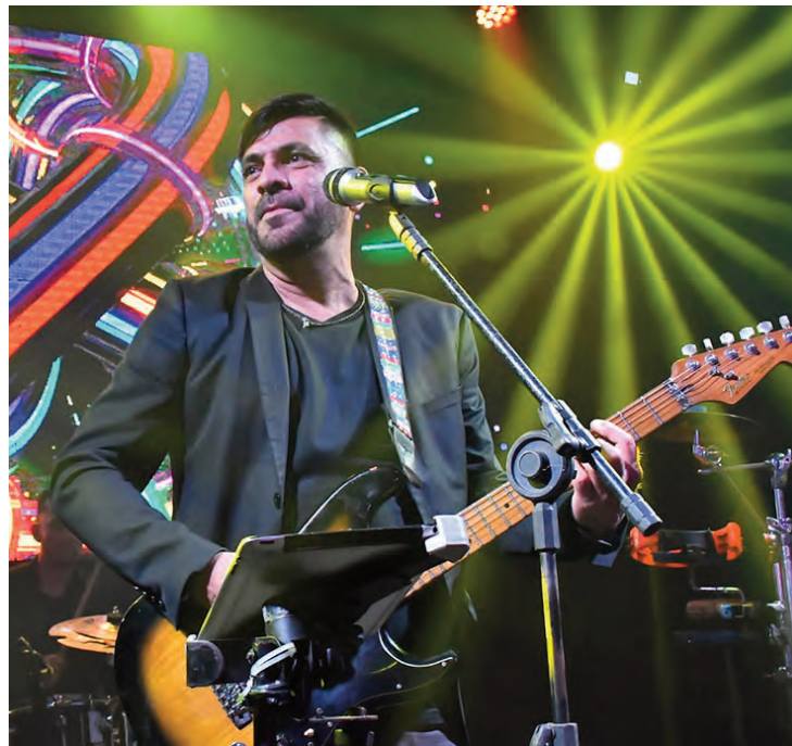
PP Junior fez um show espetacular