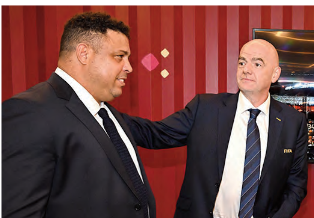
Ronaldo Fenômeno com o presidente da FIFA, Gianni Infantino