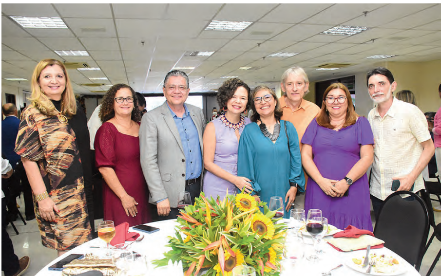
Escritores e jornalistas que prestigiaram o lançamento do livro