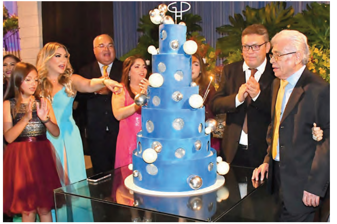
O aniversariante com a família ao lado do bolo de aniversário