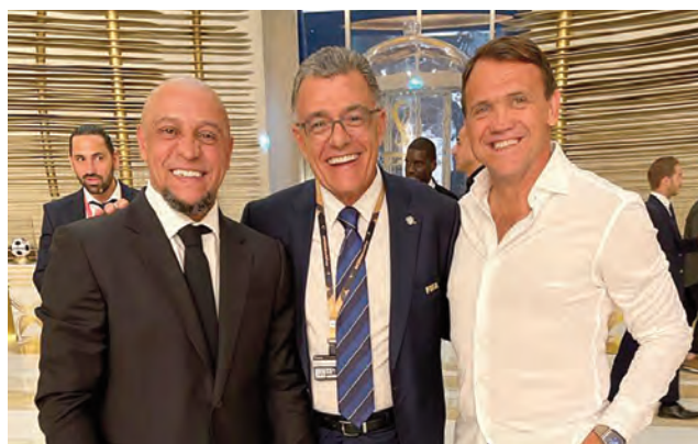
Roberto Carlos, Fernando Sarney e o ex-craque da Sérvia, Dejan Petkovic (mais conhecido como Pet, foi treinador do Sampaio Correa)