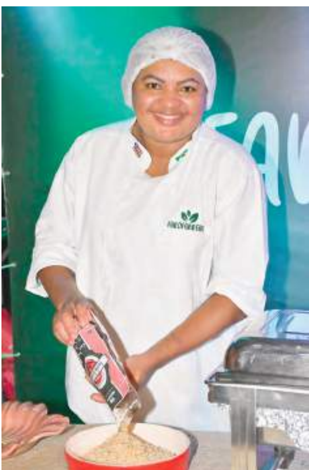
A simpática Chef do Azeite e Sal