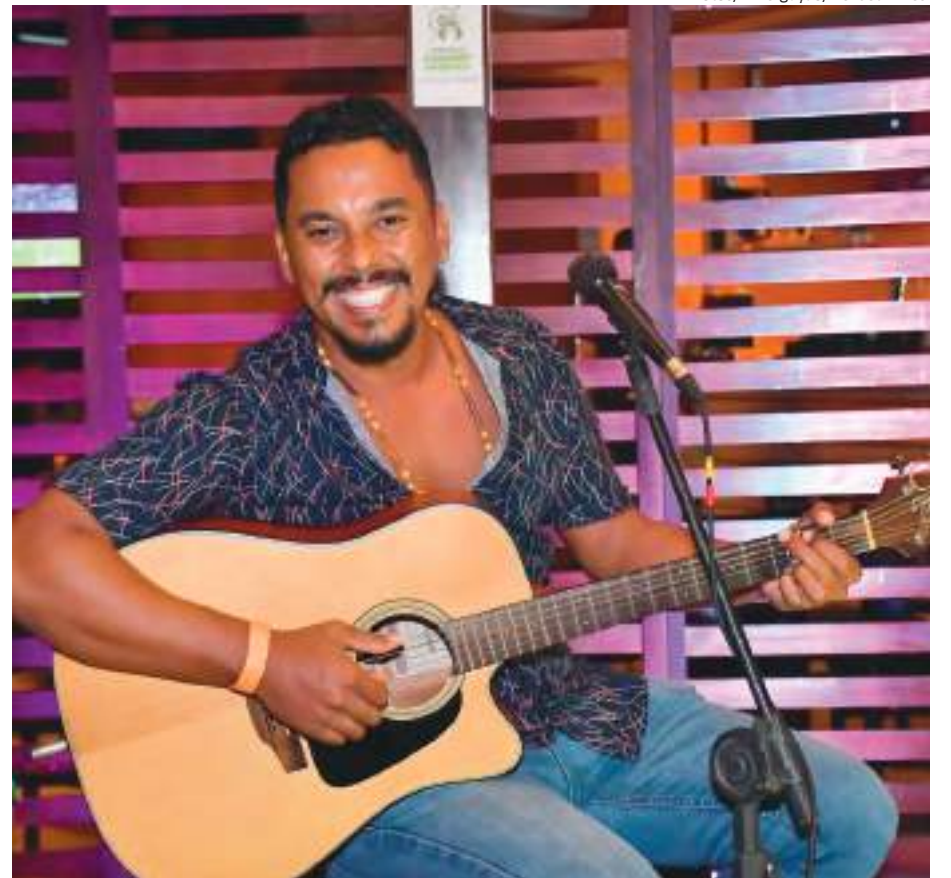
O charmoso cantor Fábio Castro encheu o ambiente de música e simpatia