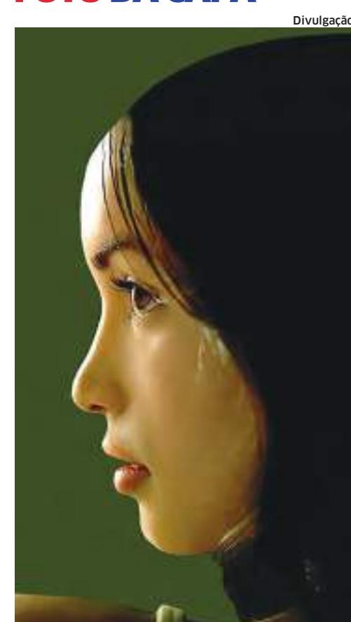
FOTO DA CAPA