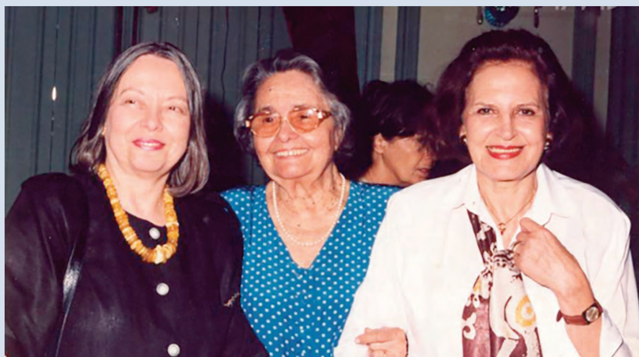
Néilda Piñon, Rachel de Queiroz e Lygia Fagundes Telles na Academia Brasileira de Letras, no Rio de Janeiro, em 1994

Lygia Fagundes Telles nos deixou órfãos de mais um expoente da literatura brasileira, no primeiro domingo deste abril. Mas ficou a sua obra, que é daquelas que introduzem o imprevisto na mais ou menos convencional evolução do universo literário.