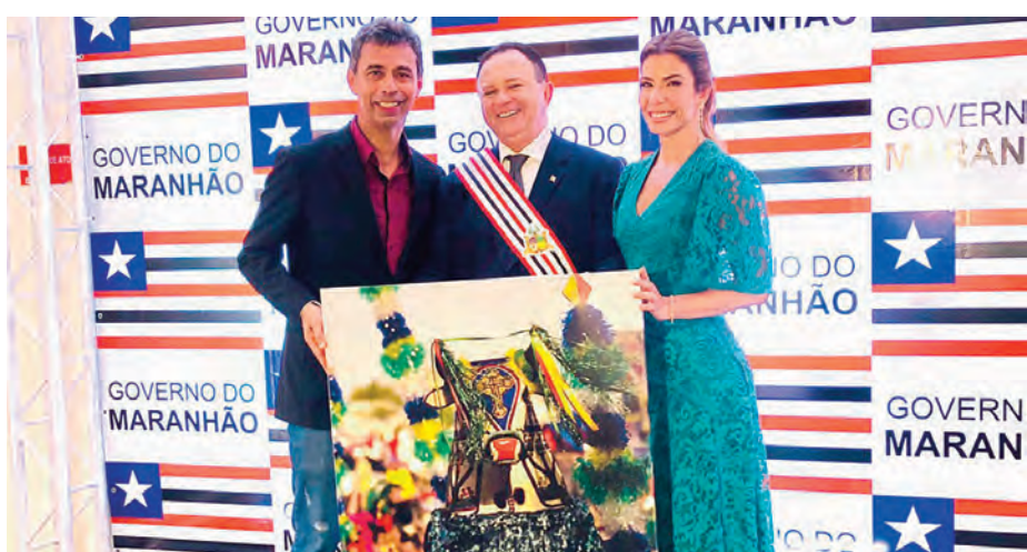
O fotógrafo Meireles Jr. presenteou o novo governador e a primeira-dama com um poster de sua autoria de uma foto do Bumba-meu-boi para incentivar ainda mais a nossa arte e cultura