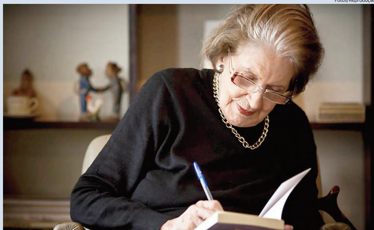
Lygia Fagundes Telles autografando uma de suas obras-primas