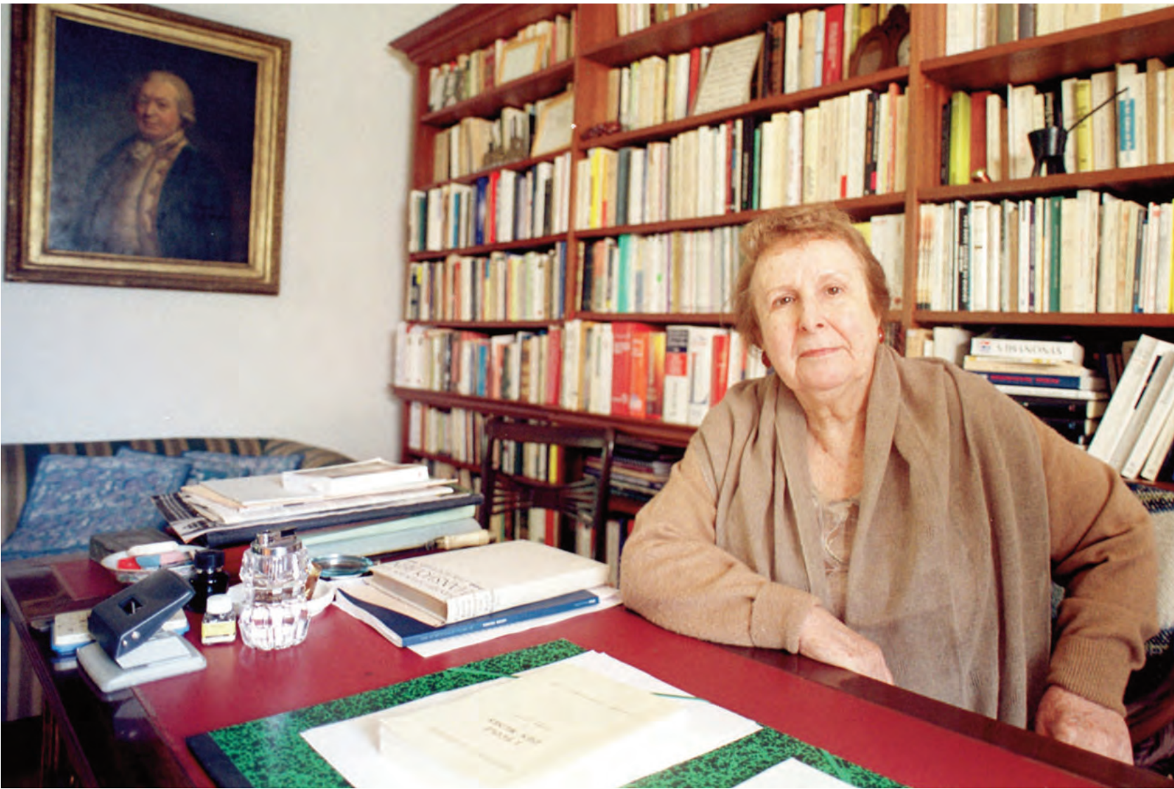
Agustina Bessa-Luís em sua famosa biblioteca, que visitei com Manoel de Oliveira na cidade do Porto, no Norte de Portugal