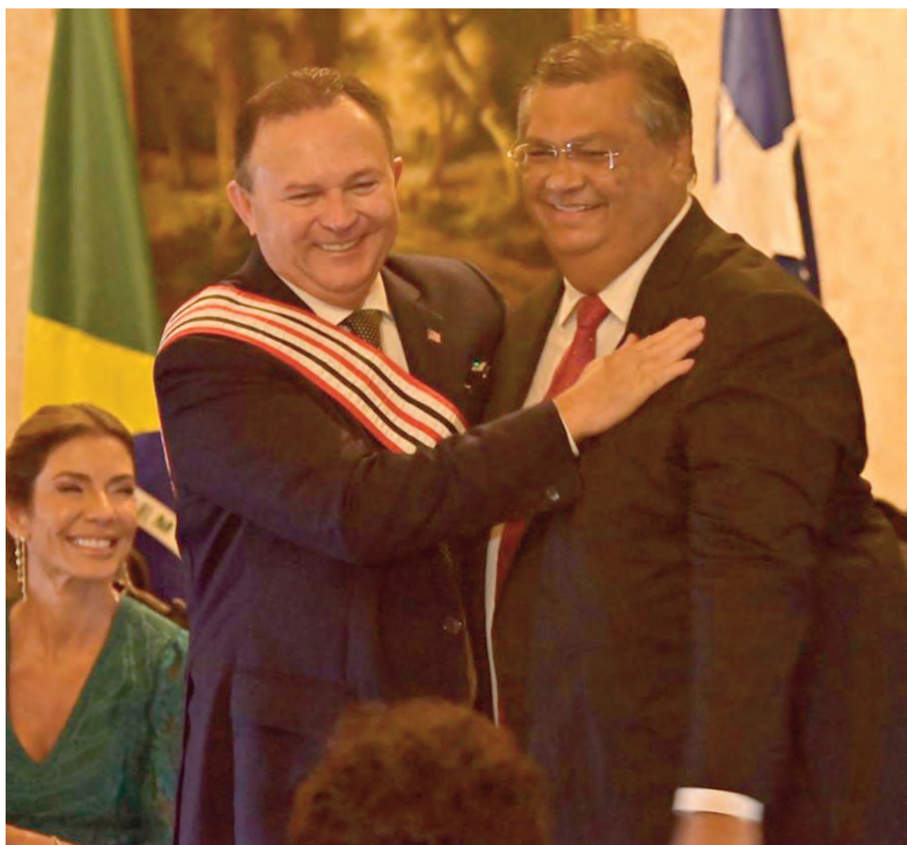
Já com a faixa de Governador, Carlos Brandão abraça o seu antecessor no cargo, Flávio Dino