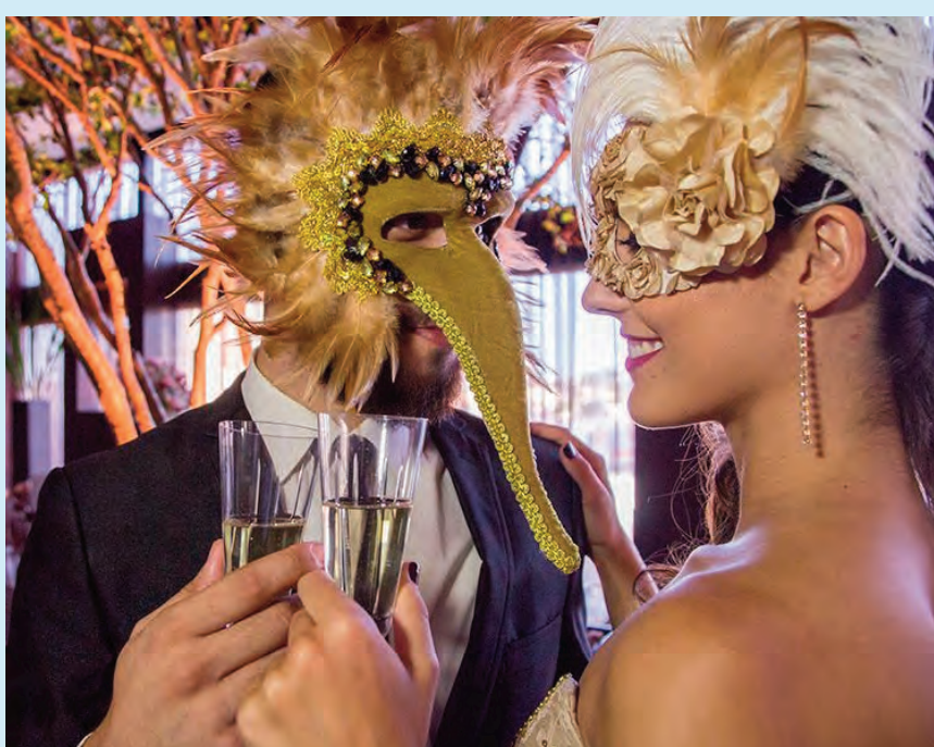
Uma linda imagem das celebridades usando máscaras venezianas nos bailes que estão acontecendo nos salões iluminados da Europa