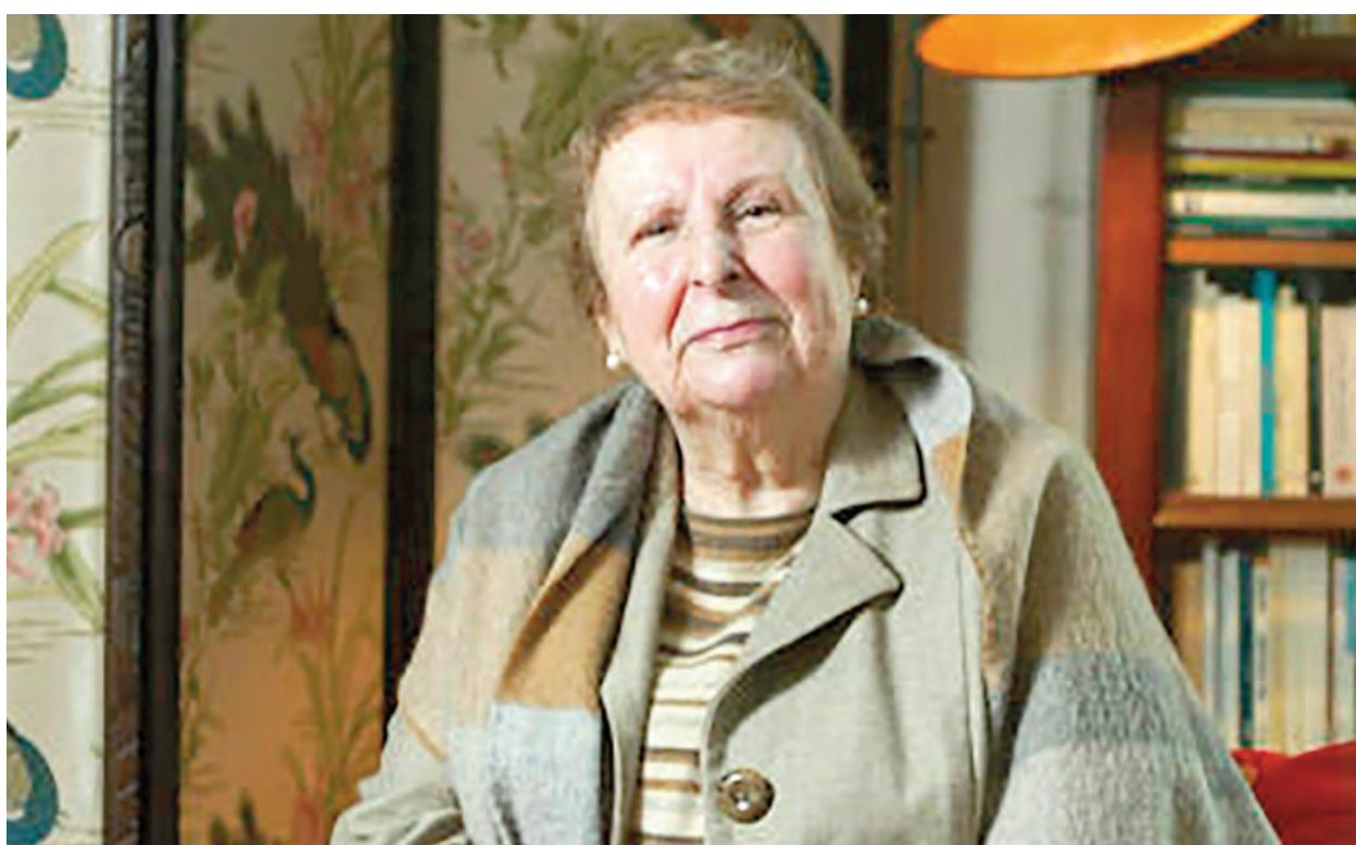
Outro momento de Agustina Bessa-Luís em sua biblioteca particular